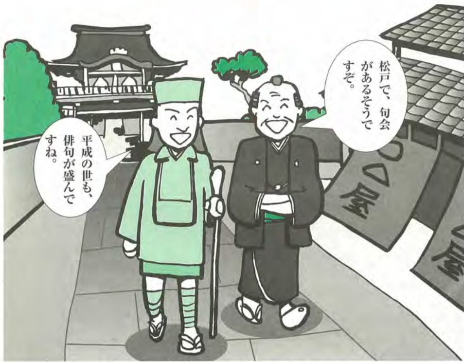
一茶と立砂は馬橋の町を談笑しながら歩いたかもしれません