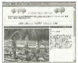
つくり兄弟が登場

http://www.intership.ne.jp/~mcity/matsudo/from21/ 圃パークセンター ☎345-8900