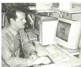
最新情報をお届けします

※英語版も用意しています。 http://www.intership.ne.jp/~miea/top.html 財松戸市国際交流協会 (市役所新館5階) ☎366-7310