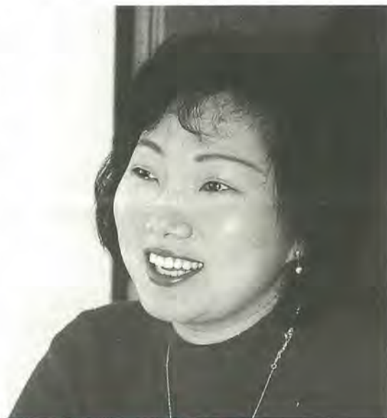
まつど国際文化大使