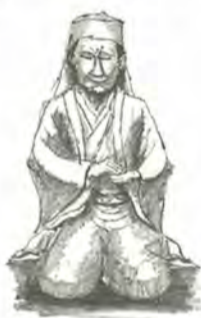
一茶の木像をスケッチ

※応募者全員に作品集を進呈 [10月31日(日)消印有効]までに、住所・氏名・電話番号を記入し、作品・費用を同封して、〒271-8588松戸市根本三三七の五松戸市役所商工観光課内「一茶・立砂俳句大会実行委員会事務局」(☎366・7327)へ