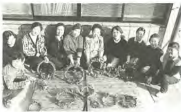
自然の素材で作ったリース

「わ」には、自分自身が「自然を楽しむわ」という意味と、みんなで「自然を楽しむ輪」を広げようという2つの意味が込められています。