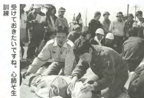
訓練を受けておきたいですね。心肺そ生

グラウンド・ゴルフ初心者教室 4月25日(日)午前9時~正午 会場栗ヶ沢小学校 対象小学生以上 費用無料 申込日会場 園体育指導委員・日江井 ☎342-7068