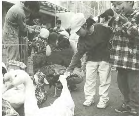
保育所の庭が動物園になりました

子どもたちに動物とのふれあいをと、小金北保育所園児の父母が企画した移動動物園が、3月27日、保育所にやって来ました。羊や豚、ポニー、七面鳥、スカンクなど約百五十匹の動物で庭はいっぱいになりました。子どもたちは、接するところが少ない動物たちに大喜び。おっかなびっくりしながらも興味深い様子で、ポニーに乗ったり、そっと小動物に触っていました。