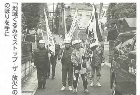
「地域ぐるみでストップ・ザ・放火」のほりを手に

新作1~3丁目町会では、町会が一体となった「放火のない明るいまちづくり」を目指して、放火防止キャラバン隊を編成しました。3月7日、防災リーダーなど約150人が参加して、燃えやすいものを道路から見るところに置いていないかなどのパトロールを行いました。