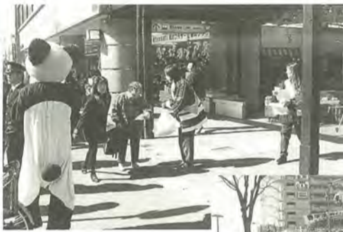
火災ゼロを目指して

地域の人たちに広く防災意識を持ってもらうと、町会の人たちが中心になってつくる「八柱を良くする会」の皆さんが、3月6日街頭キャンペーンを行いました。 会ではJR新八柱駅前ポケットティッシュや、ちらしを配布。また消防音楽隊も参加し、キャンペーンを盛り上げました。