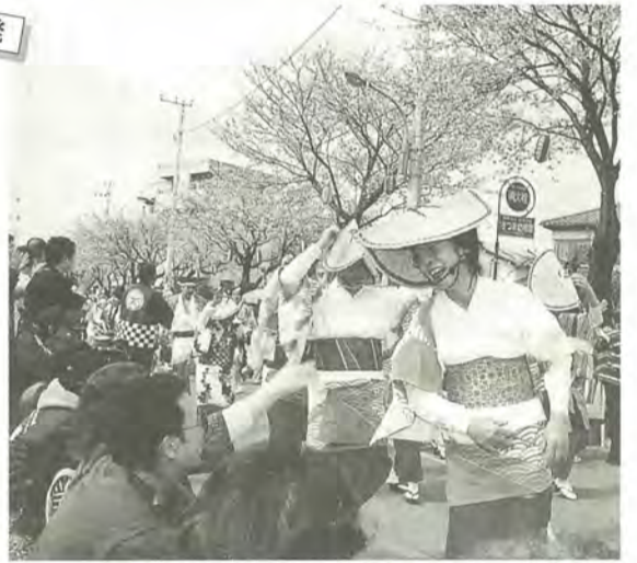
少し照れながらも声援に笑顔で

4月4日、満開となった桜の下、六実桜まつり恒例のパレードの一翼を担って、あわ踊りが披露されました。 桜まつりを盛り上げ、地域の活性化を図ろうと六実六高台地域の女性有志が企画したもので、地域を愛する人やあわ踊りが好きな人たち約70人が参加しました。衣装は急ごしらえで調達。真新しいすがすがや白足袋姿の踊り手に、沿道から声援が飛び交いました。 「機会があれば、市内のほかの祭りにも参加したい」と張り切っていました。 岡渡辺 ☎385-1486