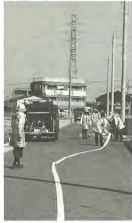
耐火服に身を包み、延長したホースをつなぐ消防団員

3月14日、東部方面隊消防団は、東部消防署と「震度7の直下型地震で火災発生、消火栓使用不能」を想定して、離れた水源から中継送水による消火訓練を行いました。 消防団は、自らの手で郷土を災害から守るため、阪神・淡路大震災の教訓を忘れず、生活に密着した地域連携の防災体制づくりに取り組んでいます。