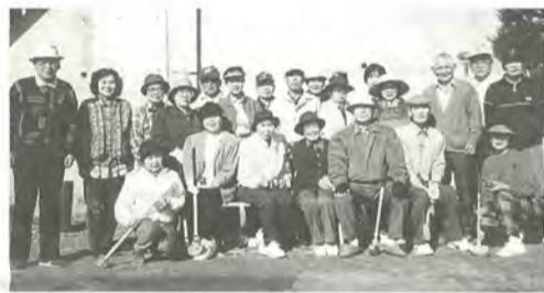
青空の下でボールを追うのが健康のみなもと

ホールイン・ワンの感激が忘れられず、毎週2回元気にプレーを楽しんでいるのは、八ヶ崎1丁目町会福寿台グラウンド・ゴルフ部52人の皆さん。部員の半数は70代で、さっそうとスティックを振り活躍する姿は、周囲が目を見張るほど。また、部の皆さんが作る「福寿台グラウンド・ゴルフ新聞」によって、地域交流の輪がますます広がっていくと好評です。