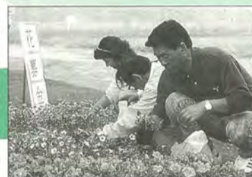
昨年のレンゲ祭りから