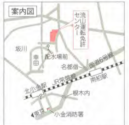
○JR常磐線北小金駅南口から新京成バス「幸田循環」で「配水場前」下車徒歩7分

問い合わせ 3月31日まで…千葉運転免許センター ☎043-274-2000 4月1日以降…流山運転免許センター ☎0471-44-0111