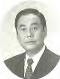
市長 川井 敏久