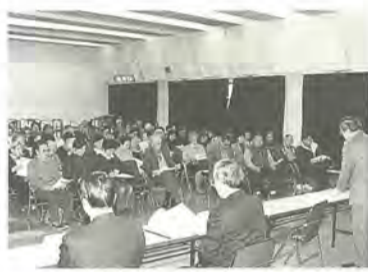
常盤平地区市民会議