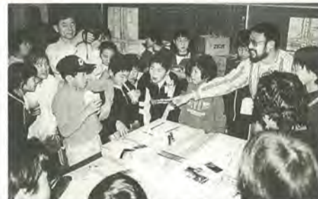
国分川の模型を作る流域の小中学生(模型づくりワークショップから)

市民と行政が一緒になって、国分川の多自然型川づくりを考えた「ワークショップ報告会」を開催します。これからの国分川の「川づくり」に参加しませんか。たくさんの皆さんの来場をお待ちしています。