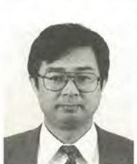
藤井 弘之 40歳 公明党