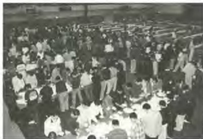
市議会議員選挙の開票風景

雪の便りが各地から届き、本格的な冬が訪れようとしています。11月15日、松戸市議会議員選挙の投票が行われ、即日開票の結果、四十六人の議員が選出されました。今後四年間の市政を託す議員の皆さんの活躍を大いに期待していると