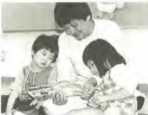
子育てなど一緒に考えましょう

日時…11月29日(日) 午前9時～午後5時 会場…女性センターゆうまつど 費用…無料