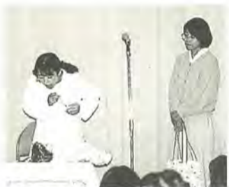
熱演する「座・ママーズ」

ママーズ・ネットは、新潟県上越市の育児グループ連絡会で、子育て環境をよりよくするため、さまざまな活動をしています。その一つに、座・ママーズの演劇があります。アンケートで、子育て中のママの生の声をひろい、つらいことや悩みなどを「ゲキ白! 子育て」という劇にまとめています。役者は、幼い子を持つ人たちです。平凡に暮らしているはずの私たちが感じている「生きにくさ」のようなものはいったい何?一緒に考えてみませんか。