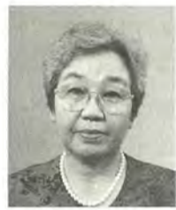
向井 俊子 65歳 日本共産党