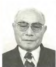
湯浅泰之助 76歳 自由民主党