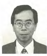
山口 博行 47歳 日本共産党