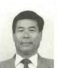
谷口 薫 63歳 新社会党