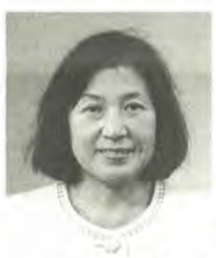
中村多賀子 53歳 日本共産党