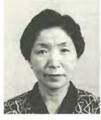
渡辺美喜子 50歳 公明党