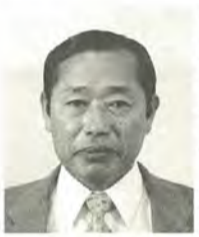
伊藤余一郎 56歳 日本共産党