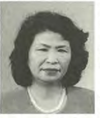
高橋 妙子 54歳 日本共産党