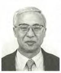
糠信 作男 61歳 公明党