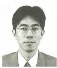
草島 剛 31歳 日本共産党