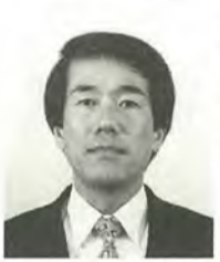
二階堂 剛 44歳 社会民主党