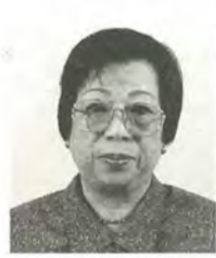
元橋スミ子 74歳 自由民主党