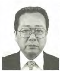
松井 貞衛 53歳 公明党