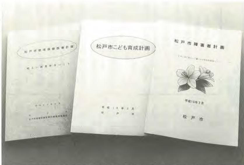
計画書は、民生局企画調整室・行政資料センターで閲覧できます

二十一世紀を間近に控えた私たちの社会は、世界有数の長寿社会であり、市民がそれぞれ多様な価値観をもって生活を営んでいます。中でも、経済の高度成長期に比べて、価値の比重が、より精神的なものへ、ライフスタイルも仕事中心から生活重視へと変化しているといわれています。 また、晩婚化や、女性の社会進出などを背景とする出生率の低下や一人世帯の増加などにより地域社会も変化しつつあります。 さらに、高齢化や生活習慣、環境(生活・自然・交通等)の変化は、市民の誰もが身体などの障害を持ち得る状況になってきています。 障害のある人も、ない人も健康な生活を送るために、安全な水や空気・歩きやすい道路・暮らしやすい住宅の整備、子どもたちが安心して生き生きと成長できる環境、互いに支えあう地域の保健・医療・福祉サービスが求められています。 平成十年度から平成二十二年までの「松戸市総合計画」(前期計画)が、スタートしました。 市では、その保健医療福祉部門の計画として、子ども・高齢者・障害者などの自立や社会参加の促進のため、保健・医療・福祉サービスはもとより教育・労働・文化などのサービスを総合的に押し進めていくために、「高齢者保健福祉計画」(平成六年度～十一年度)に加えて、「障害者計画」・「子ども育成計画」・「地域保健医療計画」を策定しましたので、その概要をお知らせします。 民生局企画調整室 ☎366・7350番