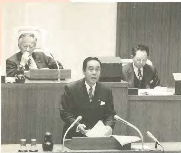
議会で施政方針を発表する市長

水とみどりの回廊づくり、検討委員会 を設置し、市民参加により全体的 な構想の立案に取り組む。 江戸川松戸川清流ライン：花畑を車 いすなどで散策できる遊歩道の整 備を完了。