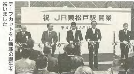
テープカットをし新駅の誕生を祝いました

3月14日、JR武蔵野線に東松戸駅が開業しました。長年の夢が実現し、感激しております。