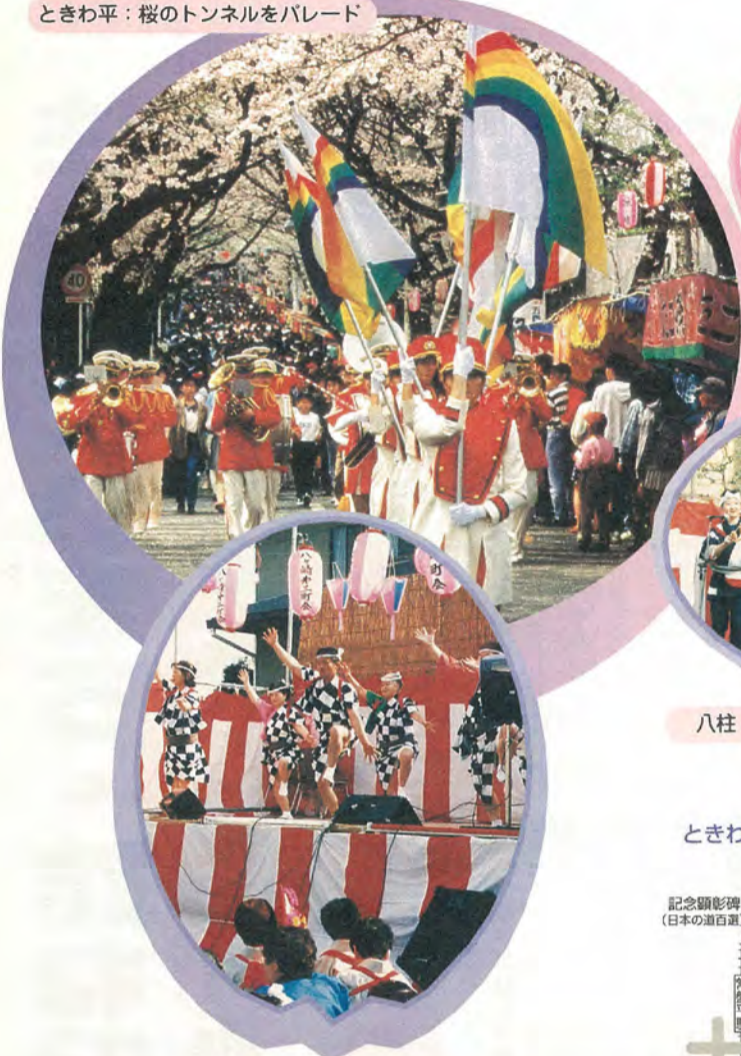
八ヶ崎：舞台上で歌や踊りを披露