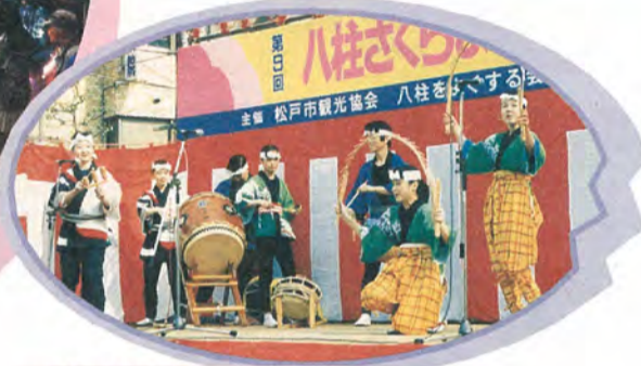
八柱：踊りや太鼓で華やかに