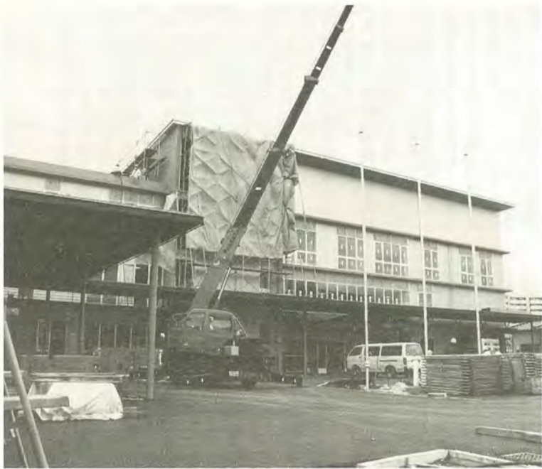
完成間近の健康福祉会館「ふれあい22」