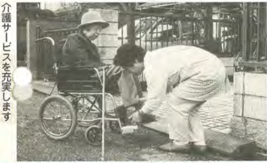
介護サービスを充実します

市民と行政の連携を深めるために、今後も試行錯誤を重ねていくつもりですが、さらに、施策の立案、実施から評価に至るまで、市政のあらゆる場面で市民と手を携えることを忘れず、新たな時代を切り開いていきたいと思ひます。