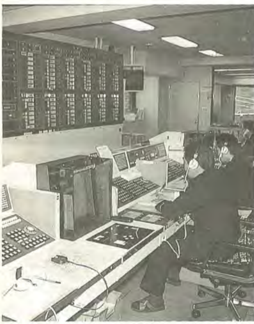
新しい消防指令管制システムで救急体制を強化します

二十一世紀の森（公園）：人口広場を 整備するとともに、レベーターを 設置する。また、整備が待たれて いる野外活動ゾーンに着手し、二 〇〇一年の全面オープンを目指す。 住宅マスタープラン：住宅施策を計 画的・総合的に 推進するための 指針としてスタ ブとして、 高層住宅、障害者 母子世帯など真 に住宅に困窮す る市民に、バリ アフリー対応を 含めた良質な市 営住宅を、借り 上げ方式により 市内三カ所に百 二十戸確保。 環境計画：自然環境を高め、公害事 象を解消し、地球環境を保全するた め、市民・事業者・行政が一体とな って具体的な作業に取り組んでい くことを示した計画。そこで、率先 して環境に配慮する姿勢を示した ため、エコオフィスの推進に努める。 ごみ処理基本計画：ごみの減量と地 球にやさしいまちづくりに向けて、 市民および事業者の協力のもとに、 引き続き先進的な取り組みを実施し 、事業系廃棄物：適正な処理と資源化 リサイクルを推進するため、リサイ クルシステムを確立する。そこで、 商工業団体の参画を得てリサイク ル委員会を設置し、松台工業団地お よび五香地区商店街で実施するリ サイクルモデル事業を支援。 リサイクルプラザ：総合的なリサイ クル事業の拠点として休館となる 六和クリーンセンター内に設置す るための検討を開始。 空き缶などの回収：市民会議の 最終提言に基づき、ごみの散乱防 止対策を実施。松戸駅周辺を美化 重点地区として、地元商店街等と 連携してモデル事業に取り組む。 自転車駐車場整備：放置自転車の人 や車の通行を妨げ、防災や周辺景 観にも大きな影響を与えている。有 料自転車駐車場を新たに五カ所導 入し、10月ごろまでに開設。 これに合わせて、新たな補助制度 により、民間自転車駐車場を育成 消費生活：消費者保護基本法は、平 成10年度に制定。2周年を迎える。 近年の、キャッチセールスや悪徳商 法はますます手口が巧妙になると ともに、食品や製薬などの安全性に も高い関心が寄せられていること から、消費生活相談員を増員し充実 地域防災計画：災害死・若者ゼロを目指