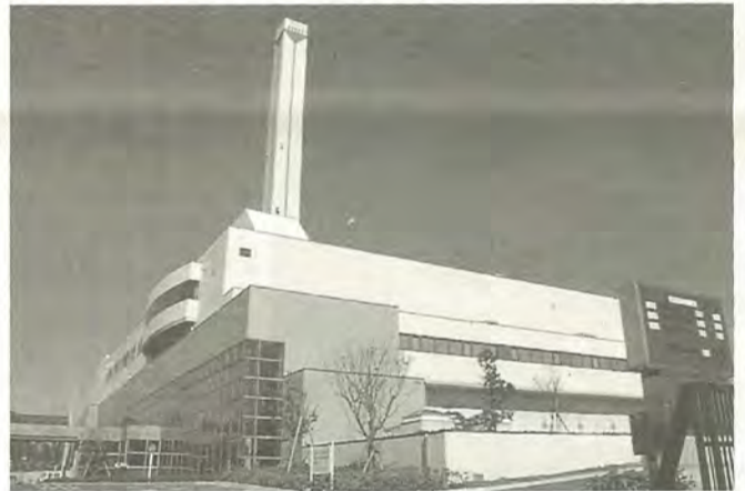
ごみ処理施設・和名ヶ谷クリーンセンター