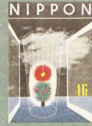
「NIPPON」16号 河野 鷹思