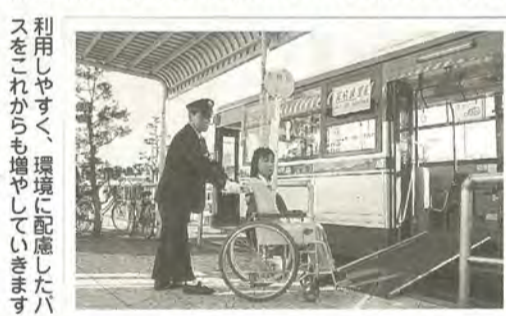
利用しやすく、環境に配慮したバスをこれからも増やしていきます

また今年、行政リストラ実施計画の最終年度となります。しかし、実施計画に掲げた目標は決してそこで終わる