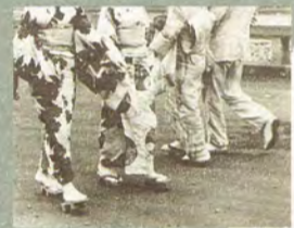
東京百景 〔明治大正のあし音〕 影山光洋