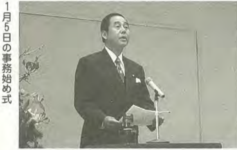
1月5日の事務始め式

新年を皆さんはどのように迎えられたでしょうか。昨年は暗いニュースが多い年でしたが、今年こそ明るい、良い年になってほしいと願っています。