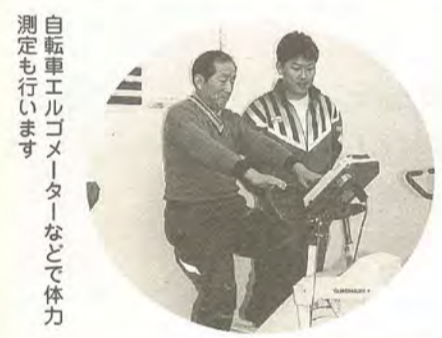
自転車エルゴメーターなどで体力測定も行います

※☆印は集団指導です。 なお、集団指導中と昼休み(12:00~13:00)は、個人トレーニングはできません。 ※第1・第3水曜日は休館です。