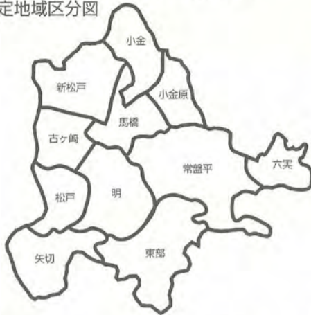
都市計画マスタープラン地域別構想 想定地域区分図

説明会の日程は、下表のとおりです。都市計画マスタープランは、全体構想と地域別構想で構成されますが、今回説明会を開催する地域の区分は、地域別構想をまとめる上で想定しているものです。