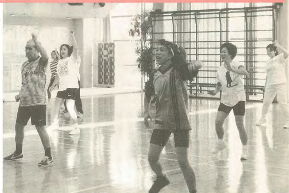
体内老化をストップ！（ダイエットエクササイズから）