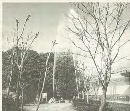
文化財は古くから守り伝えられてきた宝、大切にしよう(昨年の訓練から)

法隆寺金堂の壁面が、昭和24年1月26日に不審火により焼損しました。1月26日は貴重な文化財を火災や震災などから守るため、文化財防火デーと定められています。