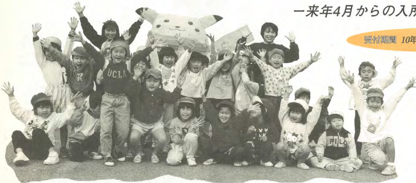
毎日元気に遊んでいます！(松ヶ丘保育所の皆さん)

保育所(園)では、保護者が働いていたり、体の具合が悪いなどで保育の困難な家庭のお子さんを、日々お預かりしています。 来年4月からの市内の保育所(園)への入所についてご案内します。 園保育課係