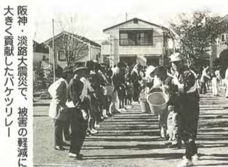
阪神・淡路大震災で、被害の軽減に大きく貢献したバケツリレー

毎月第一・四火曜日午前10時~午後2時 会場馬橋東市民センター 内容初めてのフラワーアレンジメント 費用月二千元(入会金なし・花代別) 園水田 ☎33・7029番 女声合唱団コール・メイ 毎週金曜日午前10時~午後0時30分 会場青少年会館 内容日・パーセル作曲オペラ「ディドとエネアス」を練習中 費用月四千元(入会金なし) 園大沢 ☎37・1798番