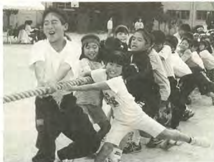
白熱した戦いを繰り広げた綱引き

10月26日、青空の下、馬橋北小学校で馬橋西連合運動会が行われました。馬橋西地区子ども会育成会の主催で例年開催しているもので、七つの町会から約700人が参加、スポーツによる地域交流を楽しみました。