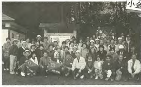
ウォーキングに参加した皆さん(大谷口歴史公園で)

12月23日(祝)午後4時30分～6時 会場常盤平市民センター 内容東葛男声合唱団を迎えてのクリスマスソング 費用三百円 藤谷 381・6079番 12月16日～10年4月26日の毎月第一・三火・木曜日午前11時～午後1時30分 会場常盤平市民センター 費用月二千五百円 (花代別) 園奥様生け花会・須藤 382・1990番