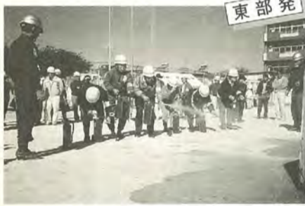
チームワークよく訓練が進みました