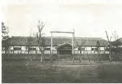
明治20年代の中部小学校(現在の伊勢丹松戸店辺り)