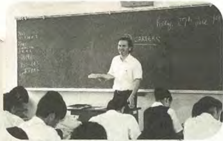
英語指導助手から生の英語を学べます