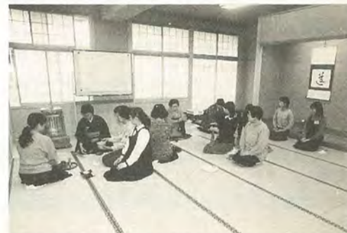
茶道から学ぶ礼儀作法(第Ⅱ期成人講座)より

タウンスクール根木内は、地域の皆さんの学習活動を支援するため、児童数の減少により生じた根木内小学校の余剰教室を、有効活用したものです。貸出教室は五室で、今回はその内の一室を和室(十八畳敷)に改造しましたので、お茶、お花、着付け、作法教室、町会・老人会等の打ち合わせなどにも使えます。 どうぞ、ご利用ください。 〒368-1214 町矢切公民館 ☎368-1214 (月曜休館)