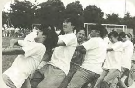
体育祭でおもいきり汗を流します

市立松戸高校は、緑に囲まれた明るくさわやかな学校です。紙敷の台地に建てられ、広大な敷地と設備を誇る環境の中で、充実した学園生活を送ることが出来ます。 募集定員 ：全日制普通科 第一学年・四百人(定員のおおむね三〇%以内は推薦) 応募資格 ：中学校もしくはこれに準ずる学校を卒業した人、または3月卒業見込みの市内在住の人 出願手続き ：所定の入学願書、定形封筒(志願者の住所・氏名・郵便番号を記入して八十円切手を張ったもの)を在籍(出身)中学校を経由して提出してください。 願書等提出期間 ：2月4日(水)～6日(金)、午前9時～午後4時30分(6日(金)は正午まで) 志願変更受付期間 ：2月10日(火)～13日(金)、午前9時～午後4時30分(13日(金)は正午まで) 学力検査 ：2月25日(水)～26日(木) 会場市立松戸高校(五香駅西口から新京成バス紙敷車庫行きで「市立高校」下車) 入学許可候補者発表 ：3月4日(水)午前9時から市立松戸高校で 〒270 市立松戸高校 ☎356・3201番