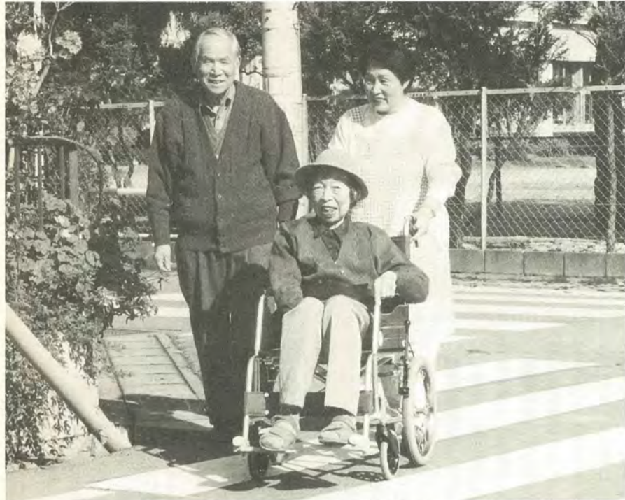
天気がいいので、近くの公園まで散歩に

財松戸市福祉公社は、「元気なときは手助けをして、日常生活に支障があるときは援助してもらい、住み慣れた地域で助け合って暮らしたい」という願いを持つ人たちを結ぶ拠点として活動しています。