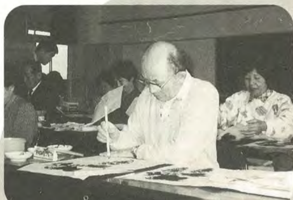
水墨絵で国際文化交流(第Ⅱ期成人講座)より