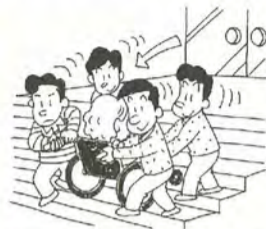
階段で車いすの上り下りを手伝うときは周囲の人にも呼び掛けましょう

障害者週間の自立、社会参加への意欲、市民の障害者問題に対する理解と認識を一層高めるため、福祉作業所等十三団体が参加し、広報活動を行います。 12月5日(金)～7日(日)午前10時～午後3時 会場伊勢丹松戸店前広場 内容各種福祉サービス体系等のPR、市内施設の紹介や作品展・販売、バザー 問しあわせ課給付係