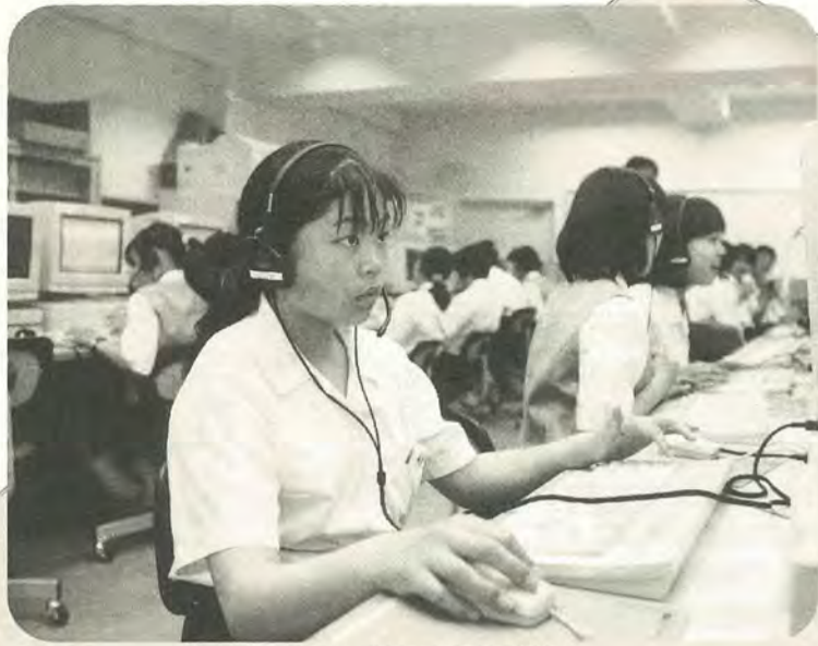
パソコンを使って英語の授業