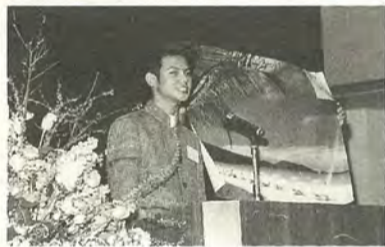
昨年の日本語スピーチコンテスト

2月28日(土)午後1時から 会場市民劇場 対象市内および近郊に在住・在学・在勤で①両親とも日本国籍を持たない②在日期間が通算5年未満③15歳以上④当コンテストで入賞経験のない人 テーマ自由(時間は5分以内) 費用無料