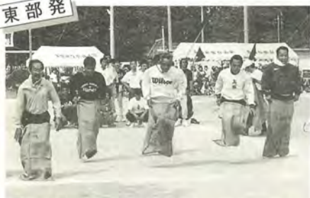
スポーツの秋を満喫しました(障害物競走)

10月19日、さわやかな秋空の下、東部地区大運動会が市立第五中学校で行われました。大会には和名ヶ谷、紙敷、河原塚、大橋、秋山、高塚新田、紙敷新田の7地区から約1,500人が参加。大きな声援が飛び交う中、地区の誇りと地域交流を図りながら秋の一日を楽しみました。