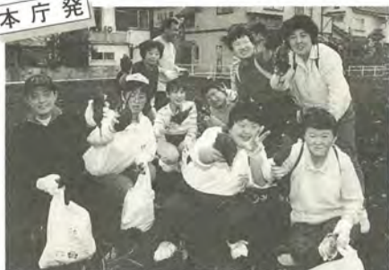
たくさん取れたよ

松戸新田の芋畑で10月7日、福祉作業所等の子どもたち約300人が、芋掘りを楽しみました。この行事は毎年、市内のスーパーが自社の畑を開放して招待しているもの。子どもたちはシャベルなどを手に畑に入り、「ヨイショ」と掛け声をかけてツルを引っぱるとサツマイモが顔を出し大喜び。ビニール袋いっぱいのサツマイモに笑顔がこぼれていました。