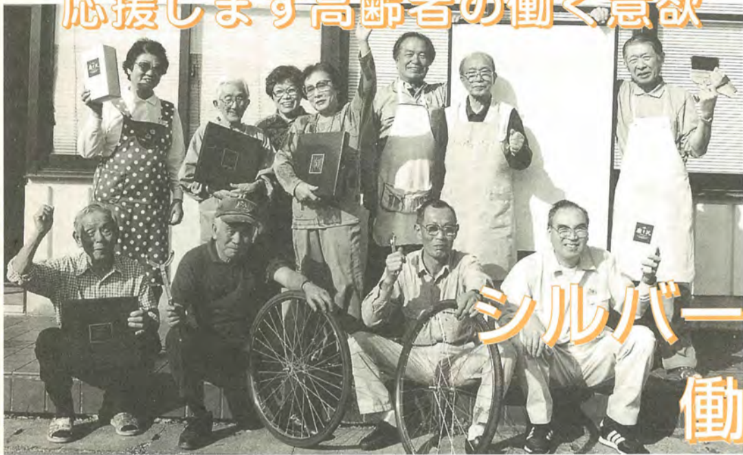
松戸市シルバー人材センターでは、985人の会員が元気に働いています