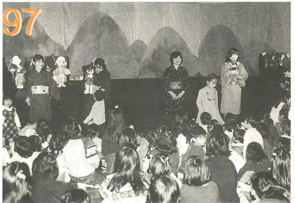
会場は子どもたちの熱気でいっぱい(昨年のおはなしフェスティバルから)

今年も年に一度のおはなしのお祭りが始まります。 当日は、たくさんのグループや個人が集まり、人形劇や紙芝居、絵本の見せ語りなど楽しいおはなしでいっぱいです。 家族そろって「おはなし」の世界を楽しんでみませんか。 ☎おはなしキャラバン ☎344-3037番