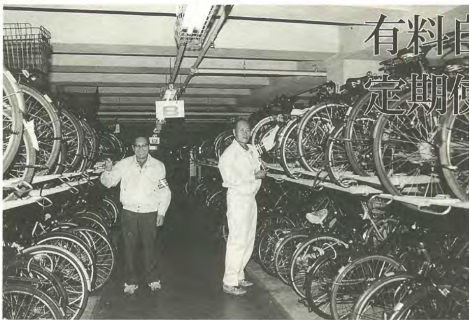
自転車はきちんと整とんされ、管理されます