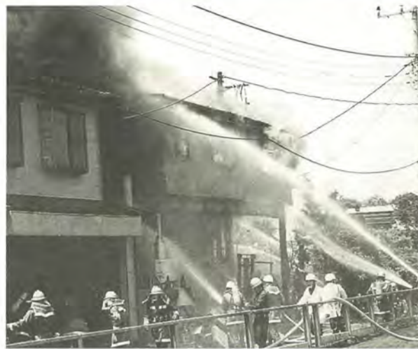
表1 防火キャンペーン日程表