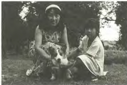
動物は愛情と責任を持って飼いましょう

11月は「動物による危害防止対策強化月間」です。動物による危害や迷惑を防止するため、飼い主は次の事項を再確認してください。