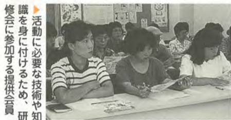
活動に必要な技術や知識を身に付けるため、研修会に参加する提供会員

市では、育児の援助を受けたい人「利用会員」と、育児の援助を行いたい人「提供会員」との相互援助活動による会員組織「まつどファミリー・サポート・センター」を設立。10月1日から活動を開始しました。 まつどファミリー・サポート・センターでは、安心して子育てができるよう、あなたの仕事と子育ての両立を応援します。