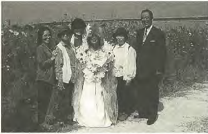
コスモス祭りでフラワーボランティアの皆さんと

暑い夏が終わり、過ごしやす い季節となりました。秋といえ ば、芸術の秋・読書の秋・食 の秋など、さまざまな秋を連 想させます。この時期は行事 が多く、いろいろな団体から ご招待をいただき、たいへん