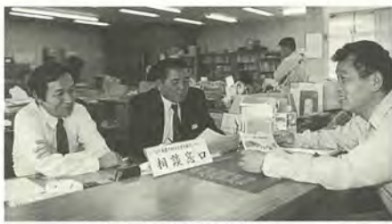
気軽にご利用ください

市民の皆さんの声を直接 お聞きするため、市長室直 通のファクスを設置してい ます。市政に関して感じて いることや建設的なご意見 をお寄せください(9月末 現在四百一件受信)。 FAX 366-2301番