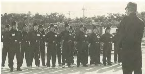
初めて制服に身を固め、緊張の面持ちで整列

サラリーマンが増加し、自宅と職場の分離が進み、今まで消防団を担っていた農家や自営業