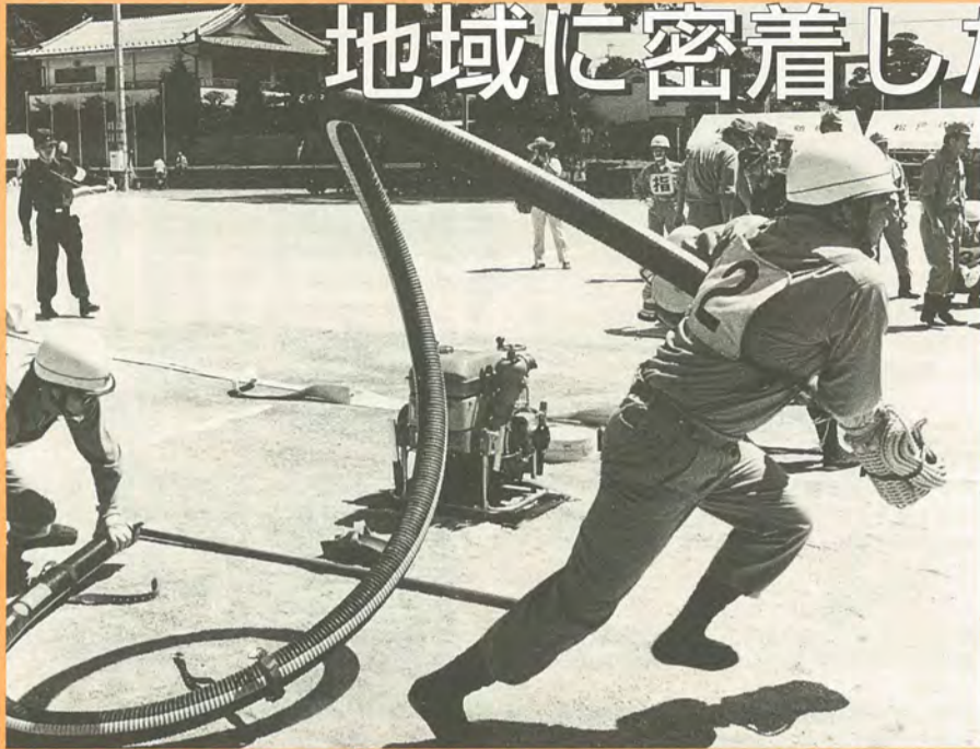
火災の発生を知るとすぐに現場に駆け付けます(夏期特別訓練大会から)

昨年、市内で発生した火災は158件、そして、2度の台風接近と4回の集中降雨がありました。