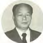
消防局長 志村 正信