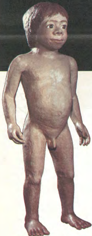
デデリエ洞窟で発見されたネアンデルタール幼児の復元像