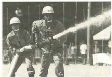
訓練でもホースを握る手に力が入ります

消防団員は、消防署からの連絡などにより火災発生を知ると、すぐに現場に駆け付けます。消防署員とともに、消火作業に直接当たるほか、後方支援として付近の交通整理や、飛び火の警戒、被災者の介護などにも当たります。