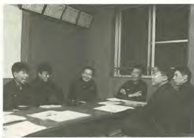
消防センター(詰所)で打ち合わせ

― ご家族の心配も大きいと思いますが 消防団の前身の消防組のころから祖父がやっていたので、三代目になります。親子二代の団員も多く、家族は理解があり、協力してくれています。 ― 一番大変だったことは 二、三年前ですが、大晦日から元旦にかけて、連続三回、火災で出動したことがありました。そのときは忙しかったですね。