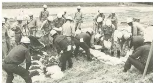
毎年、流山市と合同の水防訓練を行っています

前線は関東地方に二度の台風が接近し、また、前線の通過に伴って集中降雨が四回ありました。幸い大きな被害はありませんでしたが、大規模な場合は主要河川で水防のための警戒や、受け持ち区域の巡回、小規模の場合でも直ぐに出勤できるように自宅に待機するなど、注意を怠りません。また、台風が去った後に、倒れた公園の木や街路樹を片付けたりもします。