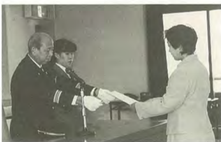
消防団長から辞令が手渡されました

者が減少するなど、団員の確保が難しくなっています。そこで、地域の防火・防災のために活動する新しい力として、10月1日に女性消防団員三十人が任命されました(応募者八十一人)。現在は、11月の発隊式に向けて研修・訓練中です。