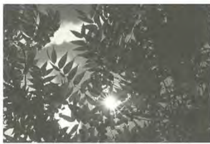
人は自然の恵を享受して生きています

①地域内の住民の主体性に基づく連携を強化する ②地域が持つ評価結果の分析と具体的な取り組みの立案機能を高める