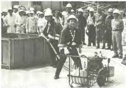
日ごろの訓練が安全で安心な街をつくります

9月1日の猛暑の中、今年も松戸市総合防災訓練が行われました。 訓練は、平成7年に発生した阪神・淡路大震災による都市型災害を教訓として作成された「大規模震災対策計画」に基づき、災害対策本部を市