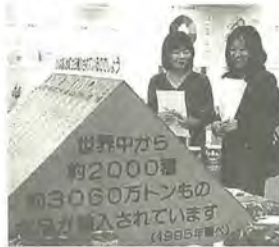
昨年の消費生活展

主な内容…カラーアナリストによるパーソナルカラーで楽しく色選び、シューフィッターによるあなたのための靴選び、スカーフでステキ・アレンジ、気軽に楽しむ二部式着物、コント衣類の豆知識、環境にやさしい繊維の紹介、いろいろな繊維、新しい表示の見方、繊維の流通経路について、クリーニングについて、保管方法と防虫について、計量コーナー、企業コーナー、消費生活センターコーナー 消費生活課消費生活係 ☎366-7329番