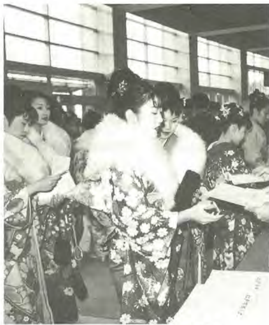
新たな一歩に希望がふくらむ新成人

市では、平成10年1月15日「成人の日」を記念して、新しく成人になられる人たちをお祝いし、ますますのご活躍をお祈りして式典を開催します。成人の人たちを中心とした、明るく楽しい多彩な行事を計画しています。 また、今回から式典を一回としましたので、市内の全ての新