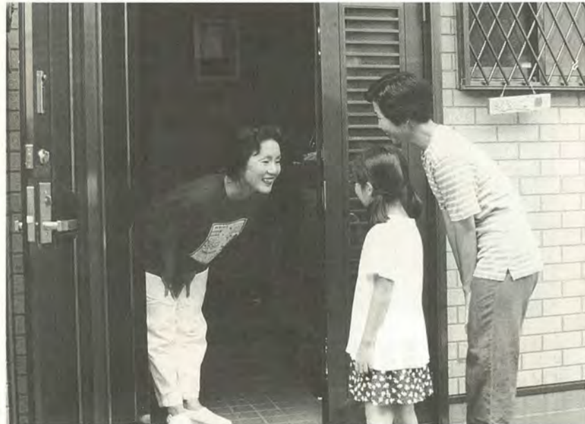
提供会員のご家庭でお子さんを預かります