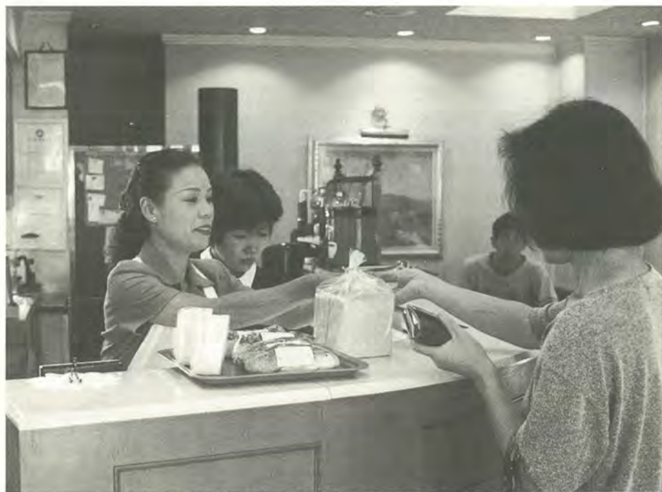
自分らしく生き生きと暮らせる「まつど」を目指します

市では、男女共同参画社会のあるべき姿を展望し、その実現に向けての指針となる(仮称)「松戸市男女共同参画プラン」の策定を進めています。