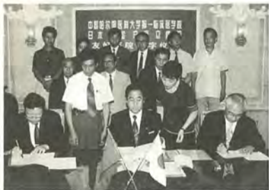
協議書に調印する市長

私は8月4日から8日まで、市立病院とハルビン医科大学第一臨床医学院との「医学友好交流に関する協議書」の調印式に出席するため、市立病院院長・同事務局長との三人で中華人民共和国(中国)黒龍江省のハルビン市へ行ってきました。