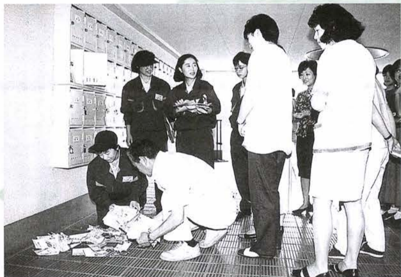
初仕事は郵便受けに入るピンクちらし対策。市民と力を合わせて解決策を考えます

ユニ21は、皆さんとのふれあいから活動が広がり、力を発揮することができます。「ユニ21」と大きなロゴの入った青い車を見かけたら、気軽に声を掛けてください。