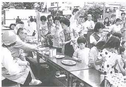
子どもたちも参加して

常盤平団地防災フェアー (常盤平) 6月8日(土)午前10時、「震度7の地震発生」を想定して、自主防災としては大規模な訓練が常盤平団地で行われました。 この防災訓練は、日常の危機管理の徹底と防災意識を高め、自主防災と行政・消防局、そして地域住民の連携を強化し、震災時に適切な対応ができるようにすることが目的。 はしご車による救助・心肺蘇生法・たき出しとさまざまな訓練に、参加した人々も本番さながらの真剣な様子でした。 中には「訓練だと思っちゃっていましたが、慌ててしまい指示どおりの事がなかなかできなかった」と緊張した様子の人も