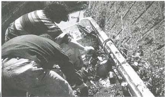
ヘドロやスカムの撤去に汗を流す、会の皆さん

「きれいな川を取り戻さなければ私たちの街も死んでしまおう」と、「新坂川をきれいにする会」と地元有志が集まり、