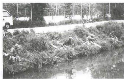
自然が残る横六間川

川の水は魚がすめるほどきれいになって、とてもうれしいことです。困ったことが一つあります。それは、釣りが置いていく「ごみ」。