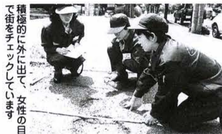
積極的に外に出て、女性の目で街をチェックしています

すぐやる課は昭和44年に「すぐやらなくてはならないもので、すぐやり得るものはすぐにやります」をモットーに誕生。従来の組織では対応できない問題について、広い守備範囲で応急措置を受け持ち、市民サービスのスピード化を図りました。その活動は行政に新風を吹き込み、全国に松戸市の名を広めました。