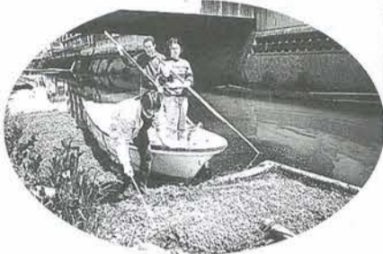
船を出しての作業です

定期的な川底のヘドロやスカム・ごみなどを取り除いています。くれぐれも、川にごみなど投げ込まないでください。