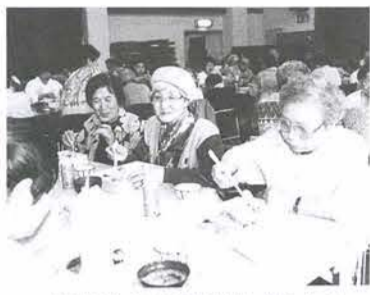
食事をしながら話はずみです

5月22日(水)、小金原地区福祉ネットワーク主催により「ふれあい会食会」が行われ、五十人あまりの人が参加しました。 会食会は、七十歳以上で一人暮らしのお年寄りを対象に行われ、今年で十年目。毎回、十人くらいのボランティアの人たちがセンターの調理室で七十人分の食事を用意しています。 この日は、21世紀の森と広場