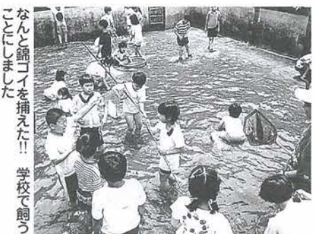
なんと錦コイを捕えた!! 学校で釣うことにしました

これは身近な自然に関心を持った児童たちが、八年前から環境活動の一環として続けているものです。 プール開きを目前にした6月1日、放流する魚を捕まえるため、学校のプールが釣り堀に大変身！近所の人たちにも開放して魚釣りを楽しめました。中には体長三十センチを超える大物を釣り上げる人も。 3日には水深を浅くして、低