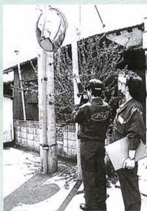
カーブミラーの破損を発見。事故が起きる前に対策を

皆さんとのふれあいが、素敵なまつどをつくる第一歩と考えています。また、提案やご意見などもお待ちしております。