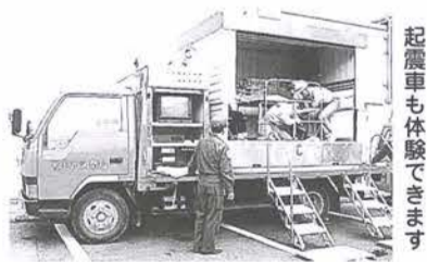
起震車も体験できます