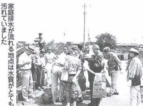
家庭排水が流れる地点は水質がとても汚れていました

国分川流域で市内ではじめて誕生した河川ボランティア団体「河南環境美化の会」の皆さんが、5月26日、汗ばむような晴天の中、紙敷川から国分川沿いの約4kmの行程で、散策ウォッチングを開催しました。 自分たちの排水がどのように流れているか、「身近な環境を観察」するのが今回のテーマです。散策には川をきれいにする課職員も同行。川沿いのゴミを拾いながら、紙敷川や国分川の水