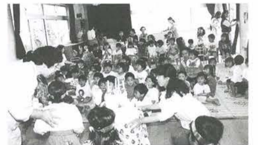
3人でケーキのろうそくを消しました