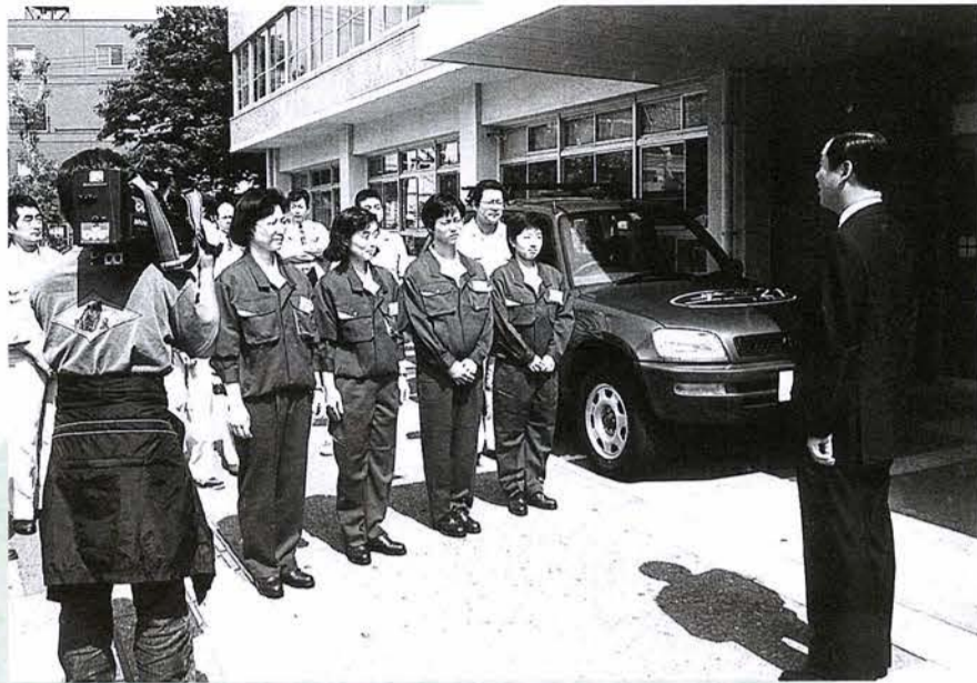
初仕事を前に市長から激励を受ける女性チーム「ユニ21」