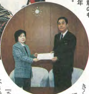
市長に提言書を手渡す有吉副会長