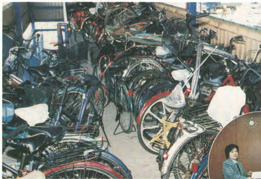
駐輪場はマナーを守って利用したいもの

公募による市民の委員を含む各委員が、それぞれの立場から「自転車問題」についての意見を交わし、参加委員の総意のもとに提言書としてまとめられ、本年3月29日、市長に提出されました。