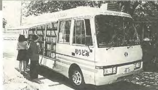
おはなしキャラバンの職員を乗せて、20カ所を回ります