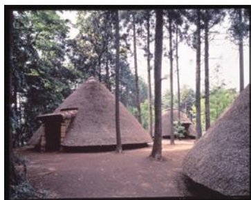
【縄文の森の復元竪穴住居】