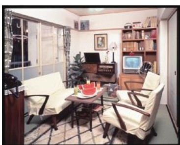
【昭和37年常盤平団地再現展示】