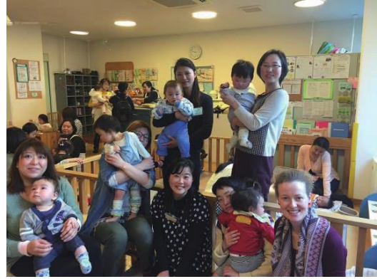
(海外から来たママとパパの広場)