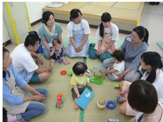
(高校生と赤ちゃんのふれあい体験 2015)