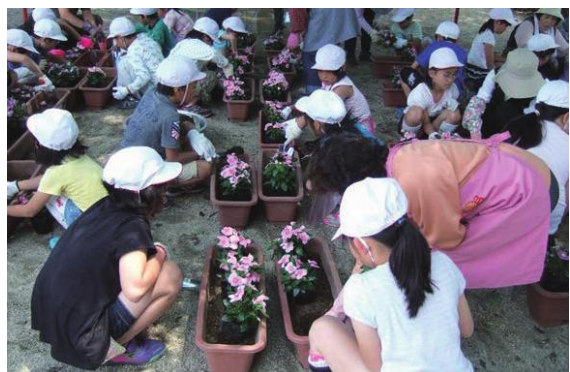
(小金地区 ふれあい花壇)