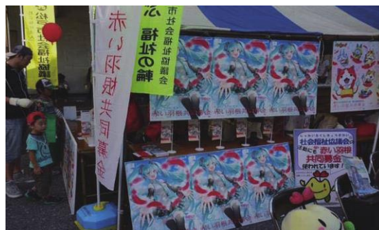
(松戸まつり 募金活動の様子)