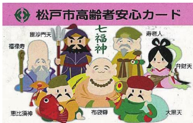
(松戸市高齢者安心カード (表))