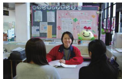
(市社会福祉協議会 ボランティアセンター)