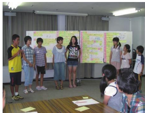
ゲットユアドリームでの様子