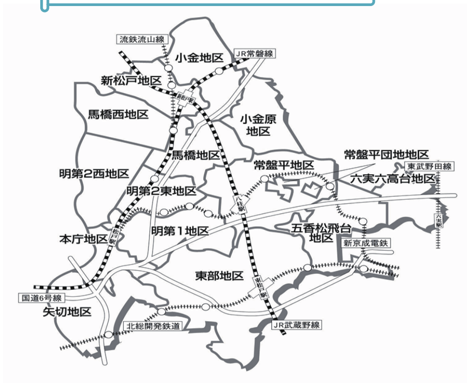
地域福祉計画推進地区（地区社協の区分）