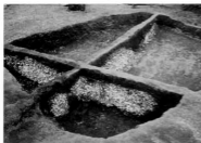
幸田貝塚の貝層堆積状況

日本列島および周辺の貝塚 日本全国には1500を上回る縄文時代の貝塚が確認されていますが、多くは太平洋岸に分布しており、地域別では関東地方にその約3分の2が集中しています。ひとくちに貝塚といってもおかれた環境の違いによってさまざまな特徴を見せます。展示では、国内の例として北海道礼文町浜中2遺跡・網路市東網路貝塚・岩手県陸前高田市中沢浜貝塚・滋賀県大津市栗津湖底遺跡第3貝塚・鹿児島県鹿児島市草野貝塚・沖縄県と那覇村シヌグ堂遺跡・竹富町下田原貝塚、周辺地域の例としてフィリピンソン高マガビット貝塚・台湾台北市圓山貝塚を紹介しています。