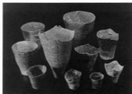
二ツ木向台遺跡出土土器（松戸市立博物館蔵）

展示では、二ツ木向台遺跡・幸田貝塚をはじめ1頁に掲げた10遺跡の出土品を紹介しています。