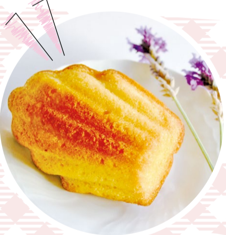
かわいいお菓子に 子どもたちも大喜び