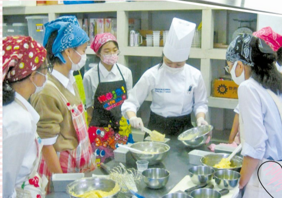
高校でも活動しています