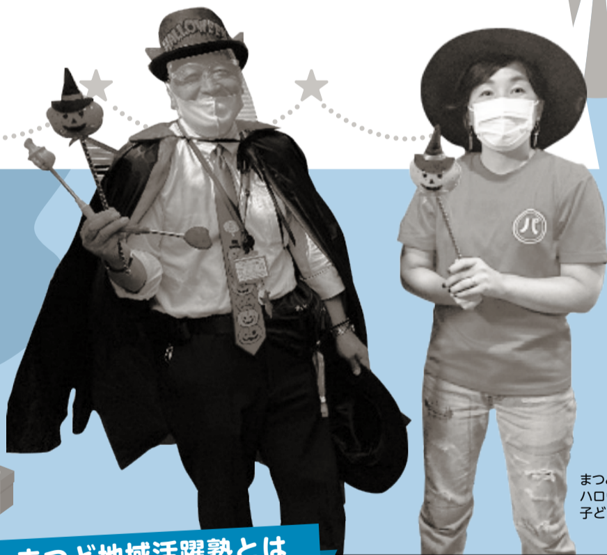
まつどフードバンク・ハロウィン子どもまつり