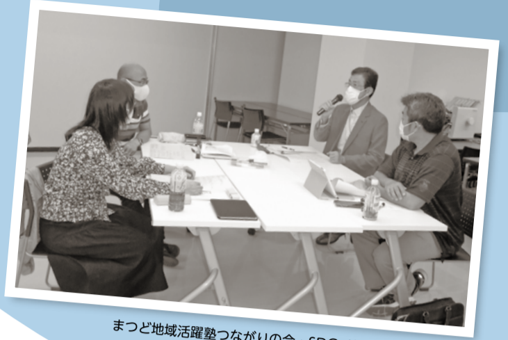
まつど地域活躍塾つながりの会・SDGs 講座