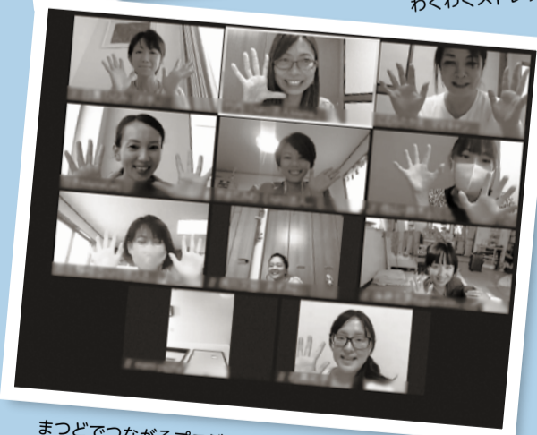
まつどでつながるプロジェクト・オンラインミーティング