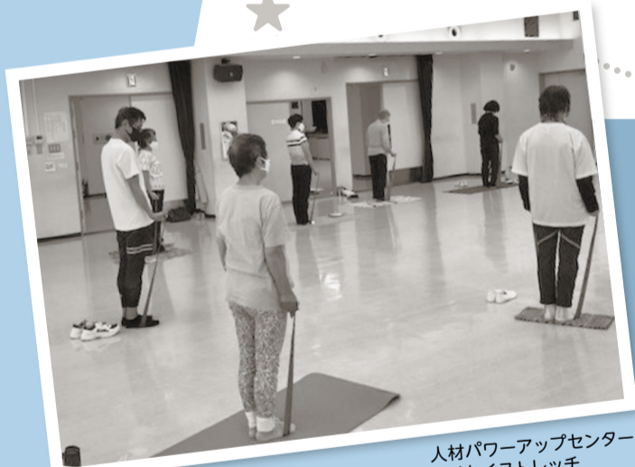
人材パワーアップセンター・わくわくストレッチ

今回の市民活動特集号では、地域で活躍したい人が受講する『まつど地域活躍塾』を修了した人にスポットを当て、現在の活動や活躍塾の魅力についてインタビューしました。