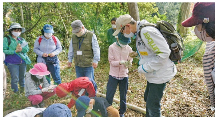
活躍塾の実地体験 (里やま維持管理活動)

市内にあるいろいろな団体がどのようにして立ち上がったのか、運営をどうするのかなどの現実的な話も聞けますし、参加して興味があることを積極的に聞いてみてほしいです。