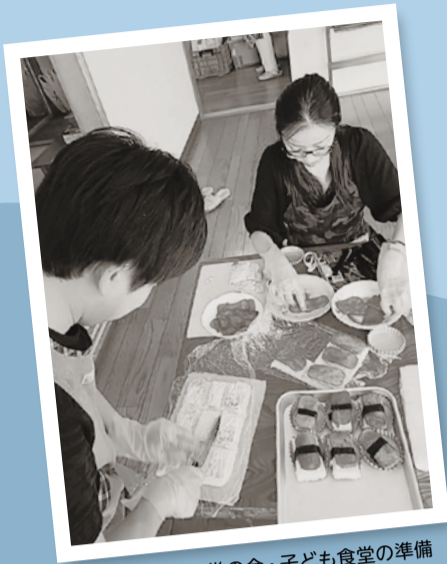
小金ほのぼの食堂の会・子ども食堂の準備