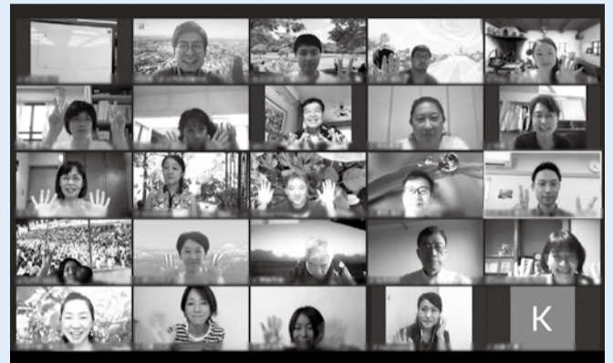
講義はオンライン（Zoom）により実施します