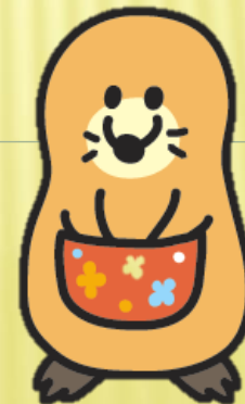
松戸市オリジナルキャラクター カイモグラ

【制度に関する問い合わせ先】 松戸市 環境部 環境政策課 TEL:047-366-7089