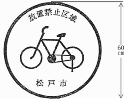
第1号様式(第2条関係)