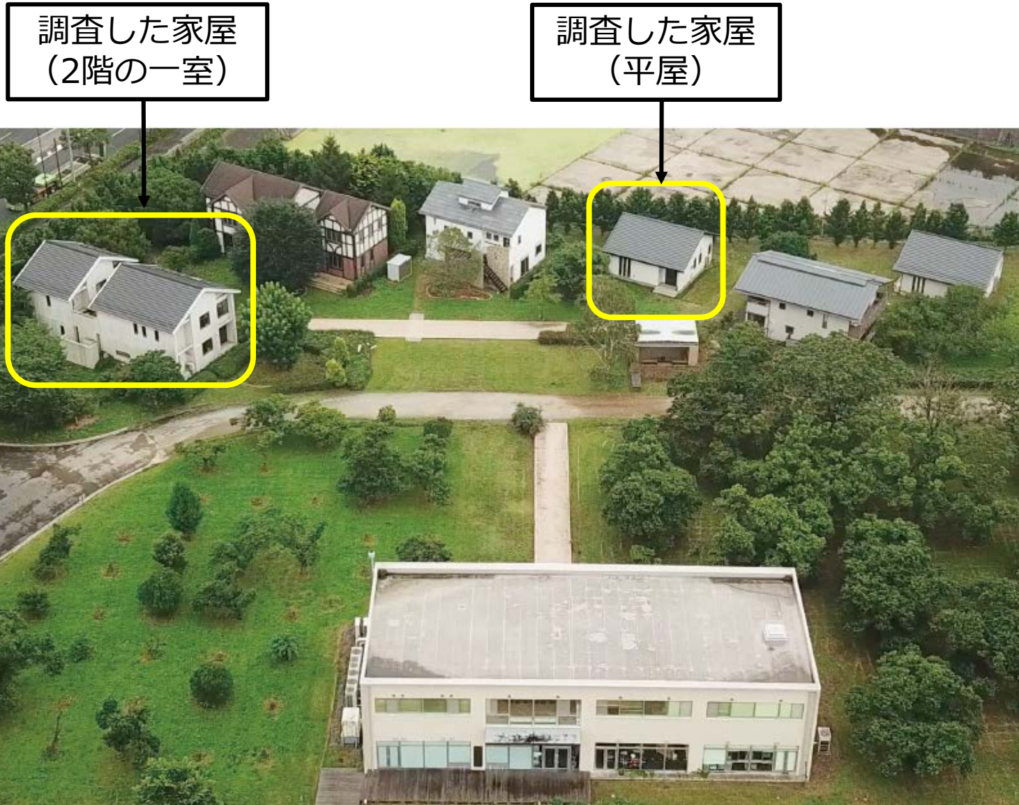
ケミレスタウン全景