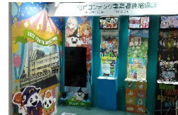
《総合医療センター》