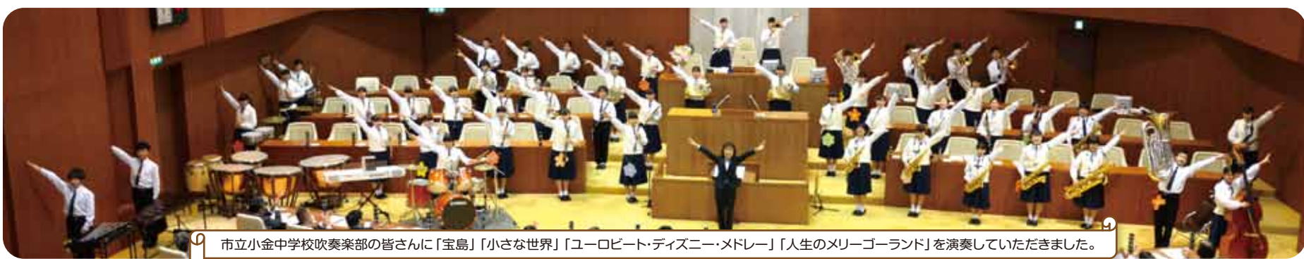
市立小金中学校吹奏楽部の皆さんに「宝島」「小さな世界」「ユーロビート・ディズニー・メドレー」「人生のメリーゴーランド」を演奏していただきました。