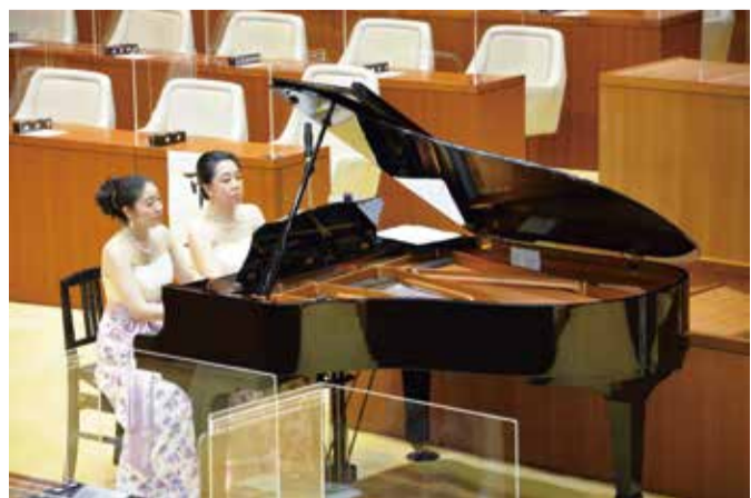
演奏者によるピアノの連弾の様子