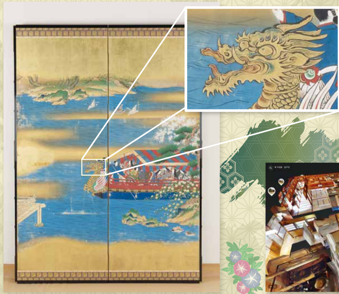
「源氏物語図屏風 胡蝶」(部分)と竜頭の拡大図