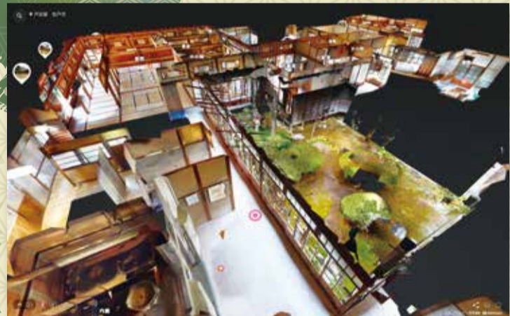
戸定邸バーチャルツアーの画像

市立博物館 TEL 047(384)8181 戸定歴史館 TEL 047(362)2050