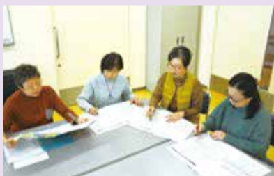
①音訳者打ち合わせ