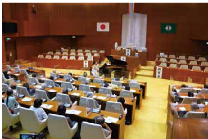
パーティーションで仕切られた議員席で演奏に聴き入る議場の来場者の様子