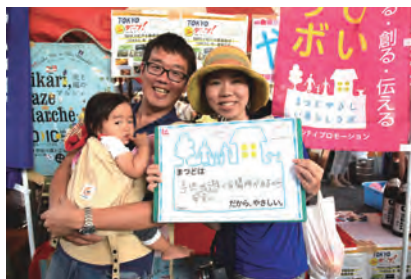
子供が安全に遊べる場所があるから (TOKU)