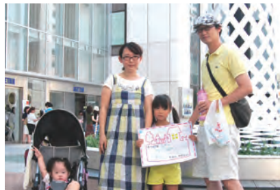
子供が遊ぶ場所が、たくさんある (コトハ)