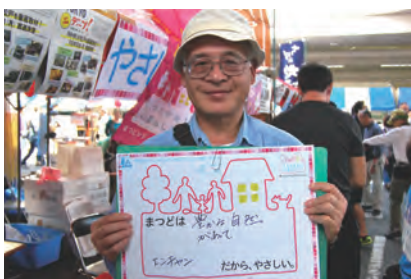
豊かな自然があって (エンチャン)