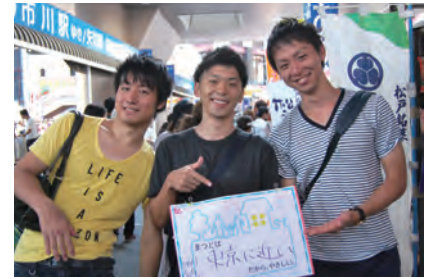
東京に近い (ひかり・もっち・おかG)