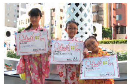
人がとても親切 (ほーちゃん) 自然を大切にしている (美月) ひとがやさしい (ひより)