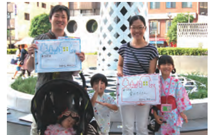
自然がたくさん 愛がたくさん