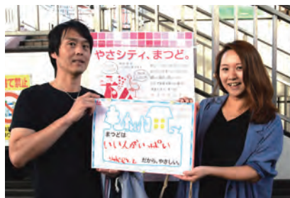
いい人がいっぱい (りゅうじ&とも)