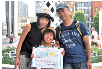
みんなが声をかけてくれる (りょうちゃん)