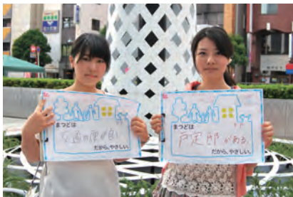
交通の便が良い (A.F) 戸定邸がある (Y.F)