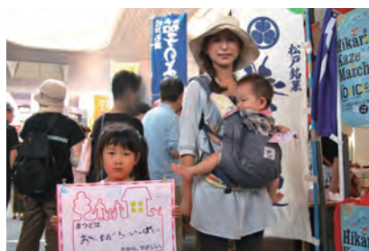
おともだちいっぱい (みんみ)