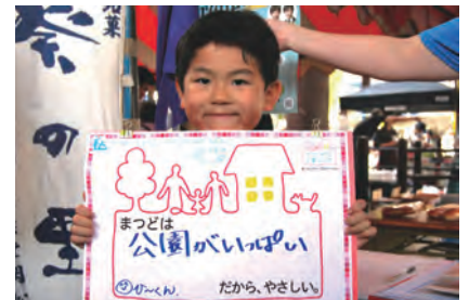
公園がいっぱい (ひ〜くん)