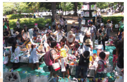
子どもたちが絵の具まみれになって遊ぶ「アートパーク」

また、市内の聖徳大学・短期大学や千葉大学園芸学部の学生の皆さんが、地域や行政と連携しながら、子どもたち向けのイベントなどを開催しています。